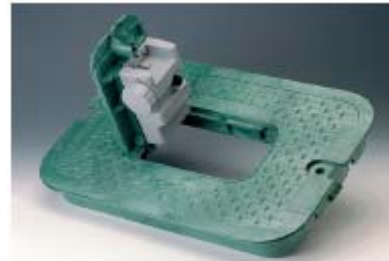
Крышка VB1419U с панелью доступа для установки блока управления TBOS™